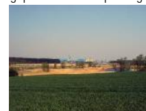
Sauziner Niederung – geplante Brückenquerung