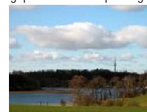
Sauziner Bucht – geplante Brückenquerung