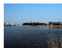
Peenestrom – geplante Brückenquerung

Darüber hinaus werden trassennah südlich von Mahlow Sukzessionsflächen ausgewiesen, die der betroffenen Avifauna einen Ersatzlebensraum bieten werden.