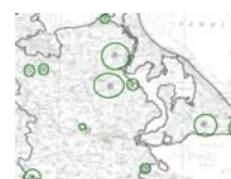
Beispiel Flächenauswahl Landkreis OVP

Die abschließende Projektbearbeitung soll in Übereinstimmung mit dem AG nach Veröffentlichung der Fortschreibung der Hinweise zur Eingriffsregelung erfolgen, da erst dann die