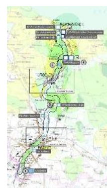
Karte Revier 06 – Uecker

Es ergaben sich Empfehlungen u. a. zu Besucher lenkenden Maßnahmen, zur Vermeidung/ Beschränkung von Nutzungen, zur Etablierung/ Qualifizierung freiwilliger Vereinbarungen (Verhaltensregeln) sowie weiterführenden Monitorings.