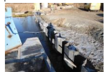
Krautziehplatz im Bau