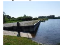
Siplanlage nach Fertigstellung