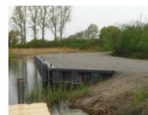
Krautziehplatz nach Fertigstellung