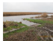
Provisorischer Krautziehplatz vorher